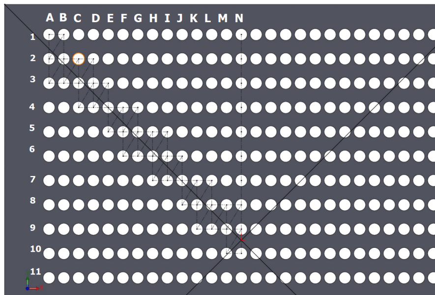
Figura 1: Mapeo del campo de velocidades al interior del túnel de viento.