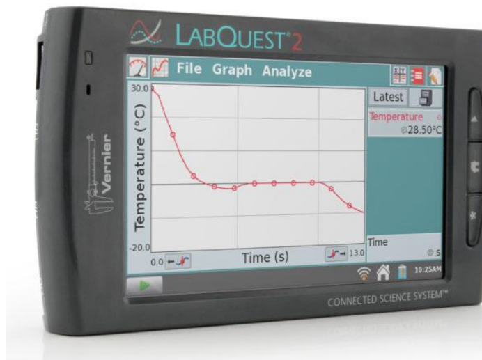
Lab Quest 2