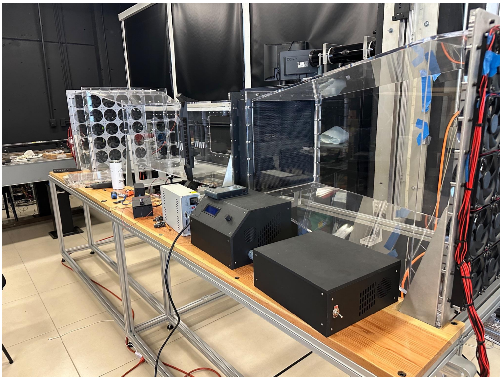
Túnel de viento